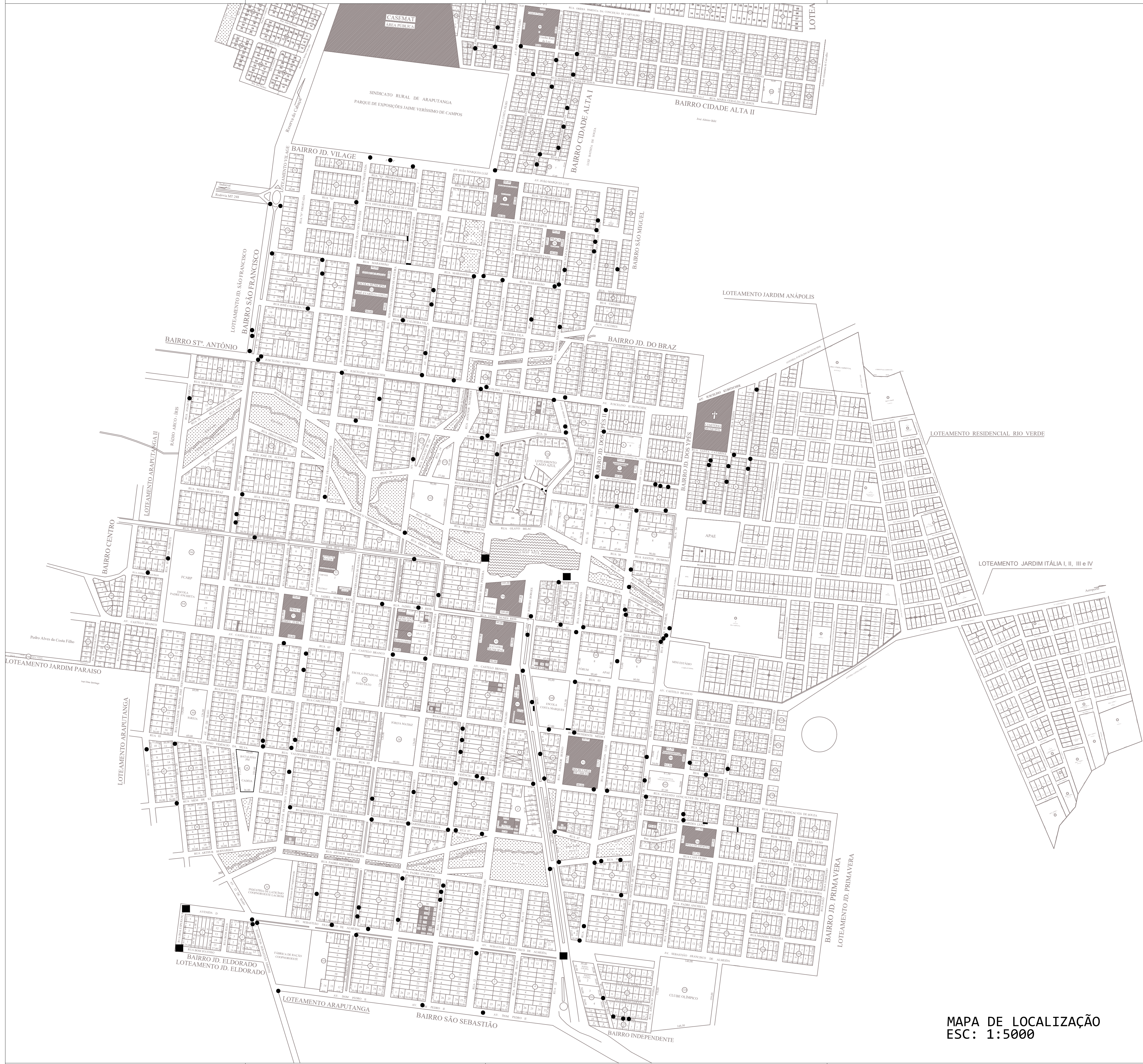
MAPA DE LOCALIZAÇÃO ESC: 1:5000